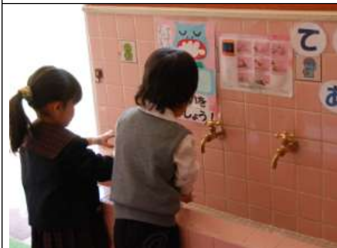
Rubinetti in rame antibatterico in uso