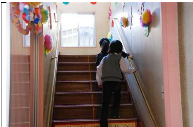
Corrimano in rame antibatterico