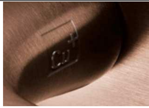
Maniglia con marchio (ingrandimento)

Per ulteriori informazioni o immagini ad alta risoluzione contattare: