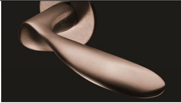
Maniglia con marchio